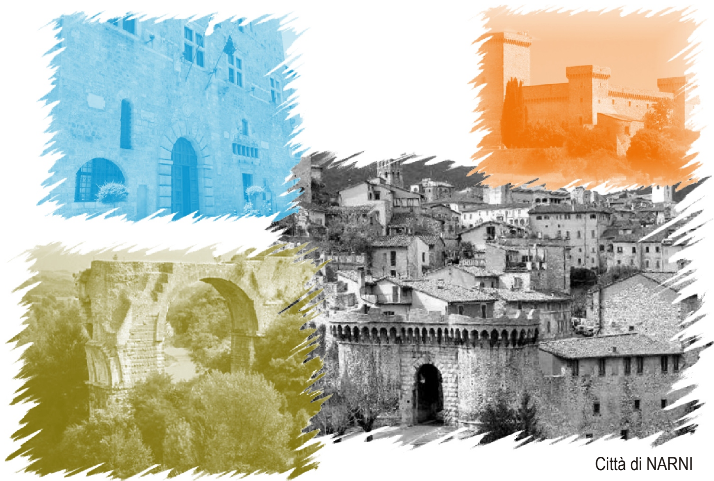
Città di NARNI